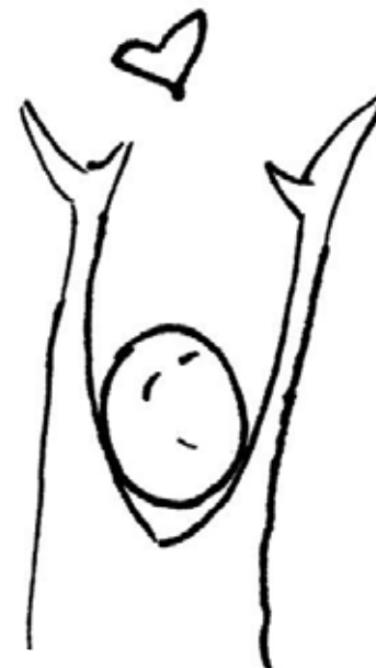
FRIZONFESTIVALEN // 19