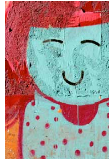
KÄRLEKEN // 8