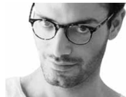
ILLUSTRATÖREN // 4