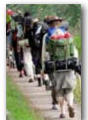
Anne Sjölin övar sig i den urgamla traditionen att vara en främling // 20