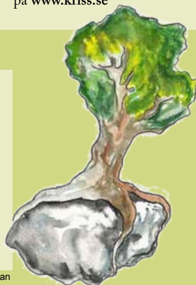
illustration: Erika Chapman

Kontaktuppgifter hittar du på www.kriss.se